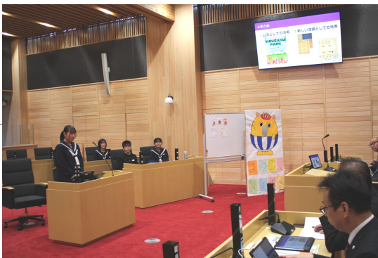
中学生議会で提案する生徒＝11月19日 波佐見町議会会議場にて(裏面に新聞記事掲載)

11月19日(火)、3年生がこれまで学んできた総合的な学習の一つの成果として「地域への貢献と発信」を目的とし、中学生議회를開催しました。発表内容はSDGs、空き家対策、耕作放棄地の開発、小児科の充実、ごみ問題、地産地消のレトロカフェなど、現在の波佐見町の姿を中学生の視点から見ると、「こうすればもっと町が活気づく」